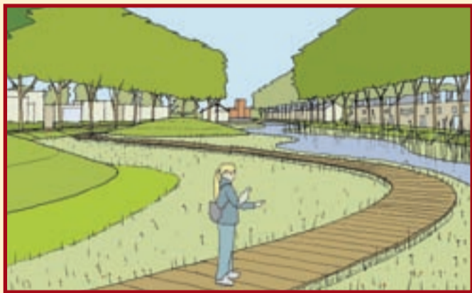
●●● A. Groene As

In het centraal gelegen park speelt water een grote rol met zowel recreatieve als waterbergende en waterzuiverende mogelijkheden.