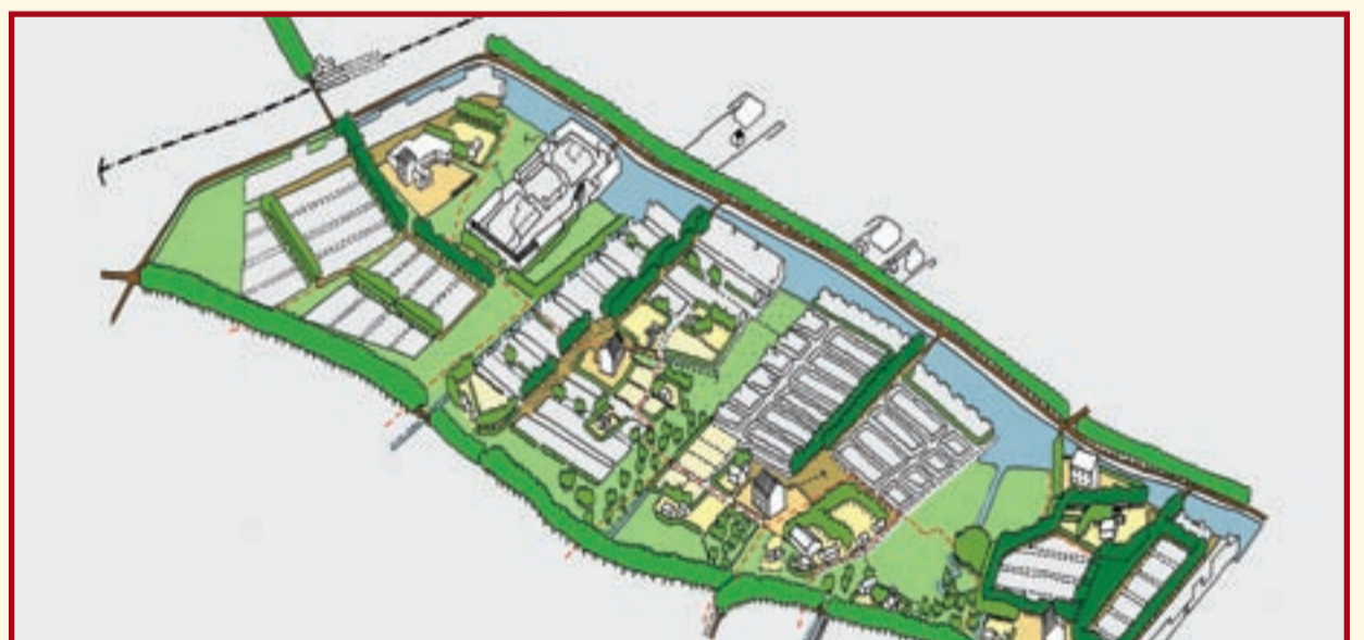
●●●● Een reeks buurtschappen en boomgaarden tussen de Leigraaf en het Lint de Sleeg