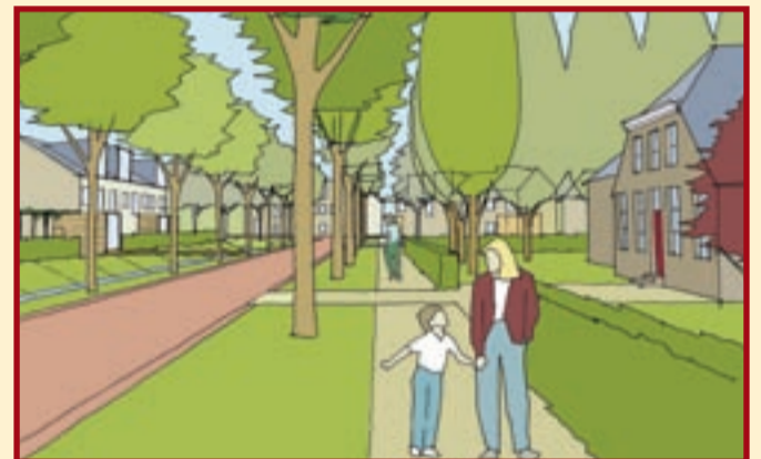
●●● C. Liemerslanen

Het Grand Canal eindigt op een plein met zicht op het hoofdbouw van Landgoed Liemers Bosch.