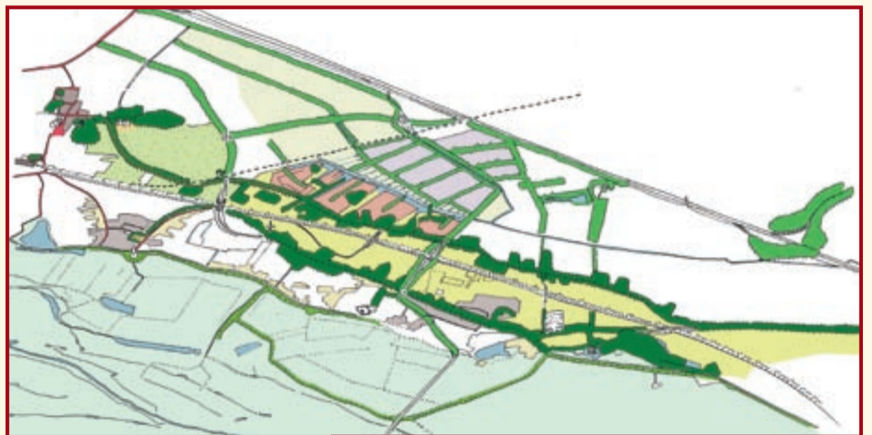
●●●● Zevenaar-Oost ingebed in het landschap van stroomruggen en komgronden