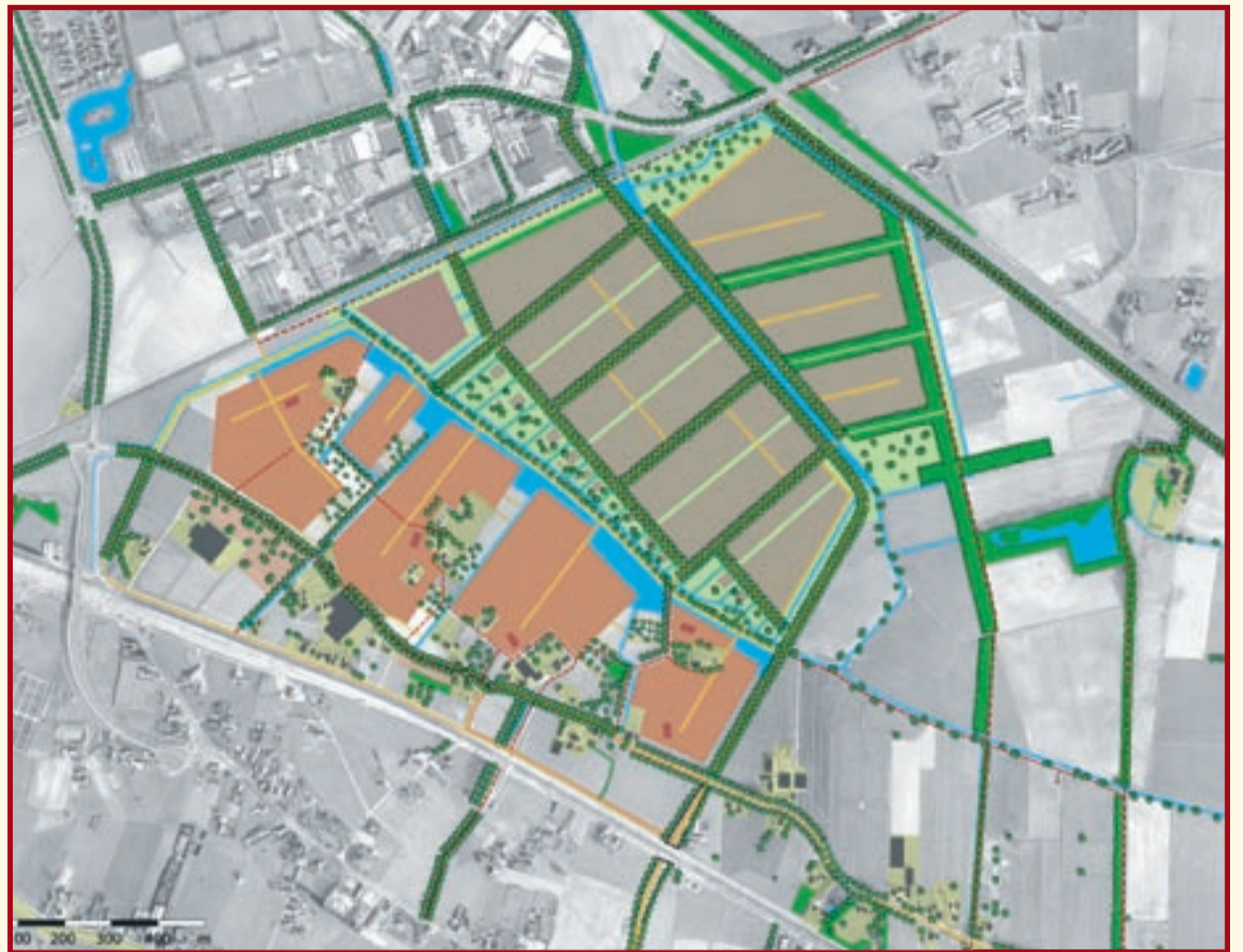
●●●● Het plan

Tussen het woon- en werkgebied ligt een brede landschappelijke strook langs de Leigraaf. Deze strook is opgedeeld in grote kavels en schept ruimte tussen de buurtschappen. De kavels zijn geschikt voor bijzondere collectieve woonvormen en combinaties van wonen en werken. Dichterbij het nieuwe station van de regioliijn is ruimte gereserveerd voor stedelijke voorzieningen.