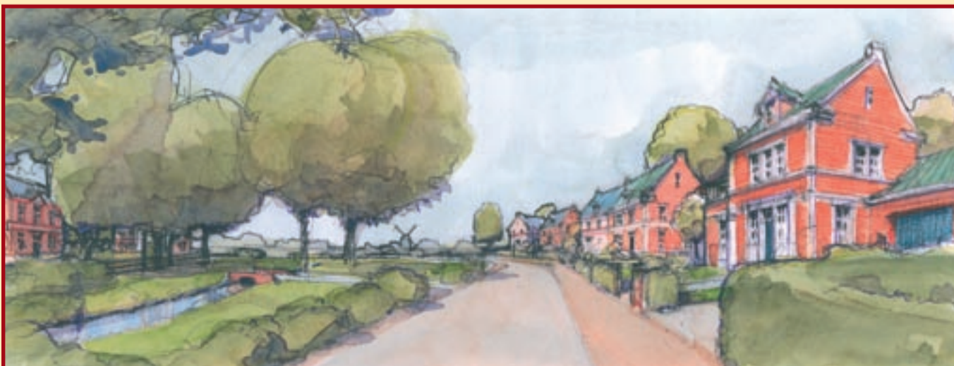
Zicht op de molen

Ten slotte ondersteunt de stedenbouwkundige invulling het ruimtelijke beleidsplan, waarin is gekozen voor de situering van een bedrijventerrein in het gebied tussen de Leigraaf en de A12. Waarbij het van belang is dat het bedrijventerrein qua uitstraling en identiteit aansluit bij het woongebied van Zevenaar-Oost. Voorgesteld wordt een gezamenlijke muur om de bedrijven te plaatsen, waarbinnen functies als parkeren en bevoorrading zijn geregeld. De voorkanten van de bedrijven krijgen dan een representatieve zijde die aan doorgaande groenstructuren zijn gelegen.