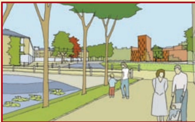
●●● B. Liemersbosch

In het centraal gelegen park speelt water een grote rol met zowel recreatieve als waterbergende en waterzuiverende mogelijkheden.